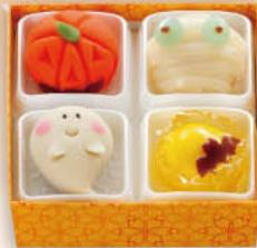
ハロウィン和菓子