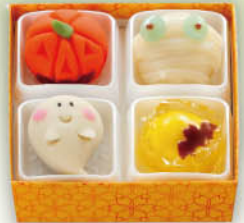
ハロウィン和菓子

●商品のお渡しは13時以降となります。●申込時、「お客様控え」をお渡ししますので、指定日にお持ちください。●ネット予約の場合は、指定日に店頭でお名前・商品名・お申し込み時に確認画面に表示される受付番号をお申し付けください。●お客様の手紙やカードを商品と一緒にいれることはできません。●限定数量に達した場合、予約受付を終了させていただきます。●商品お引き取り後は、消費期限内にお召し上がりください。●商品には皿などは含まれておりません。●予告なく、飾りが変更となる場合がございます。予めご了承ください。●商品のパッケージが異なる場合がございます。●商品のアレルギー物質表記は、原材料に使用されている特定原材料7品目(卵・小麦・乳成分・そば・落花生・えび・かに)についての記載しております。●本体価格(税抜価格)と税込価格を併記しています。●写真は全てイメージです。