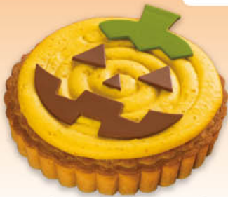
ハロウィンパンプキンタルト